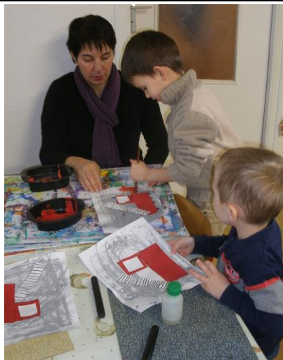
En arts visuels, nous avons réalisé des camions de pompiers !