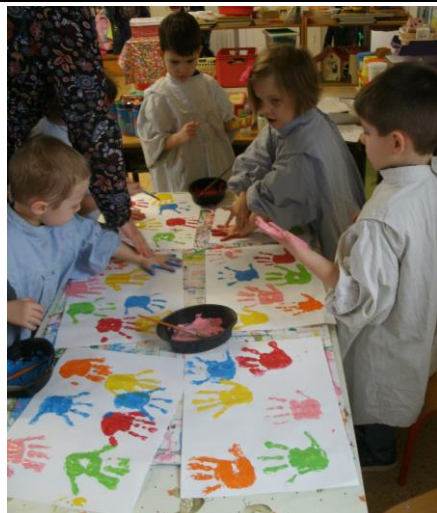
Nous avons peint un fond avec nos mains avant de dessiner un bonhomme à la peinture noire.