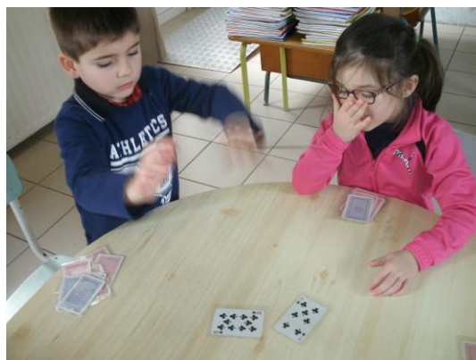
Nous avons appris à travailler à la bataille.