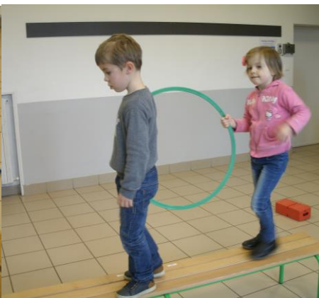
En activités physiques, nous avons appris à nous déplacer à deux sur un parcours sans lâcher l'objet que nous tenions.