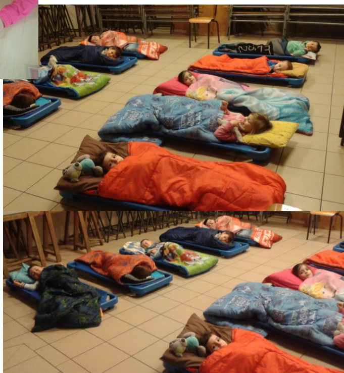
Depuis le retour des vacances, nous avons changé de salle de sieste. Nous dormons maintenant sur la scène de la salle du patronage !