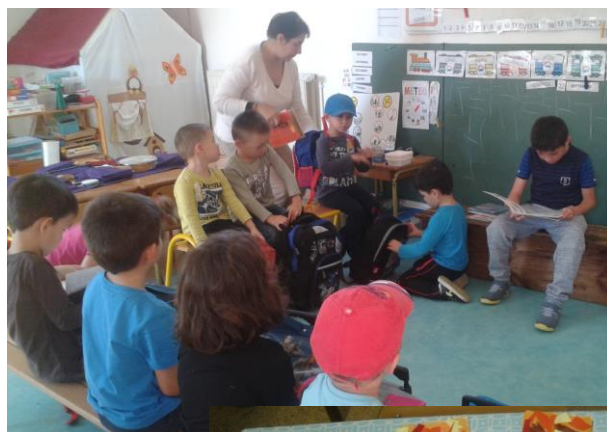
Le soir, un CM vient nous lire une histoire.