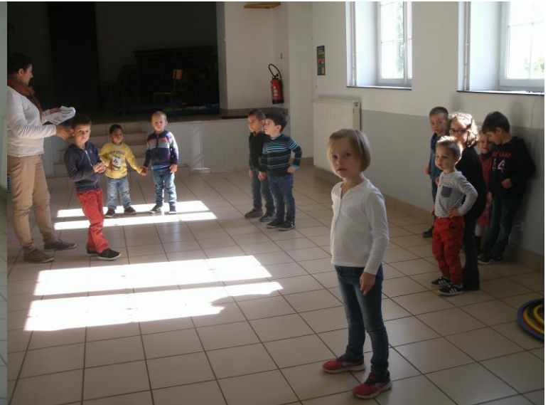
Nous avons appris à jouer à accroche-décroche.