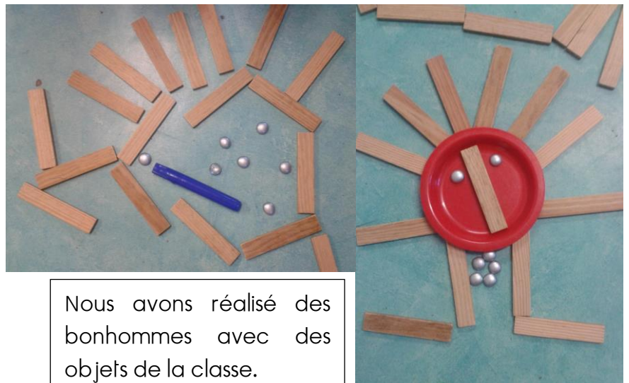
Nous avons réalisé des bonhommes avec des objets de la classe.