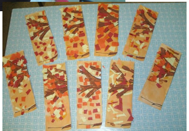
Nous avons peint des arbres d'automne : nous avons encré le fond, puis peint les branches et enfin nous avons découpé des petites feuilles dans des feuilles de couleur et nous les avons collées.