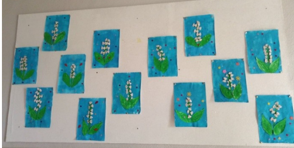
On peint des pates. On a collé pour faire du muguet.