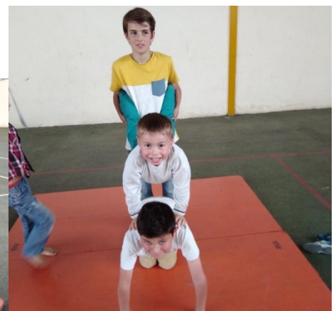
On a fait de l'acroport. On fait des figures.