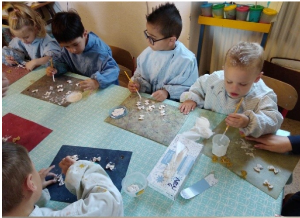
On a peint des pâtes en blanc. Avec les pâtes, on a collé des feuilles pour faire du muguet.