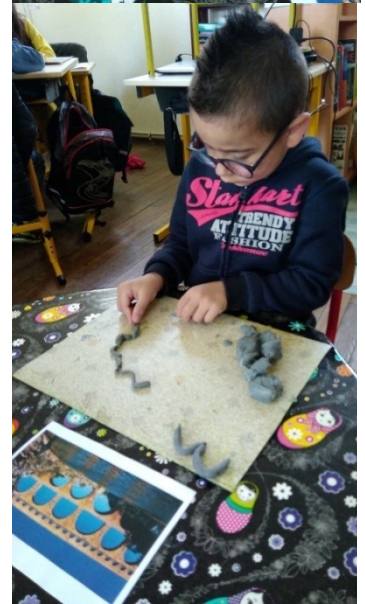
On a fait des ponts en pâte à modeler et avec les crayons.