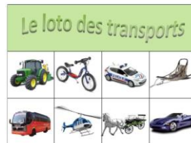
On a lu l'histoire du Loup qui ne voulait plus marcher. On a joué au loto des transports.