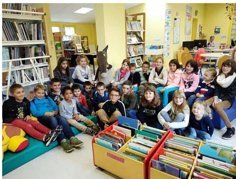
On est allé à la bibliothèque et on a vu un P'tit Loup très grand.