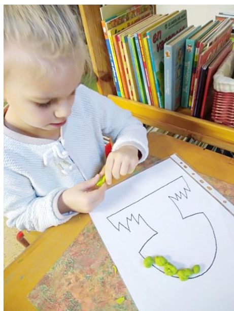
On a roulé des boules de pâte à modeler.