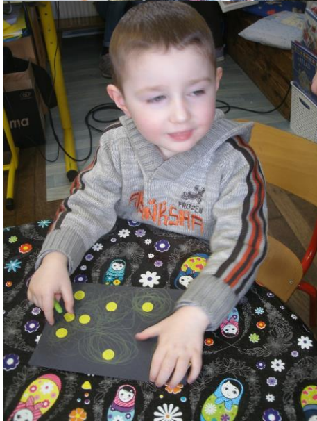
Nous avons collé des gommettes et tourné autour avec la craie grasse.