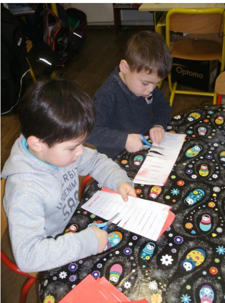
Nous avons peint, décoré et découpé des lanternes chinoises.