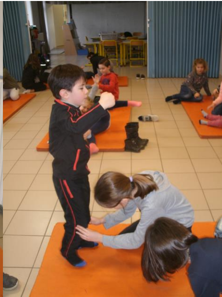
En expression corporelle, nous avons joué au sculpteur.