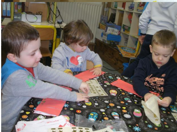
Nous avons peint et décoré des lanternes chinoises.