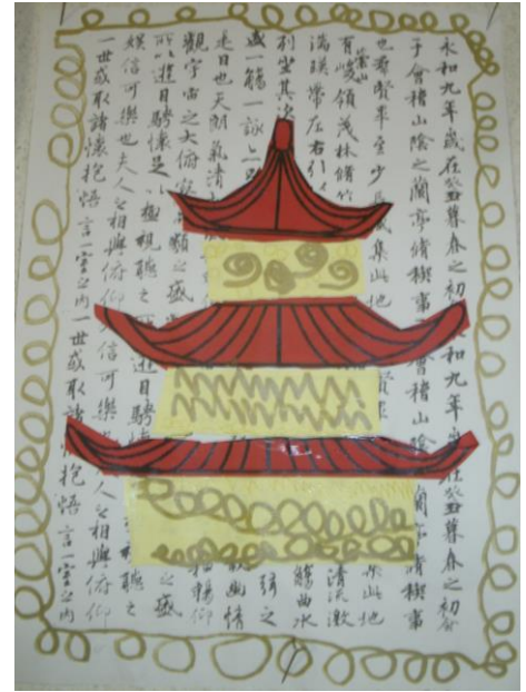
Nous avons construit et décoré des pagodes.