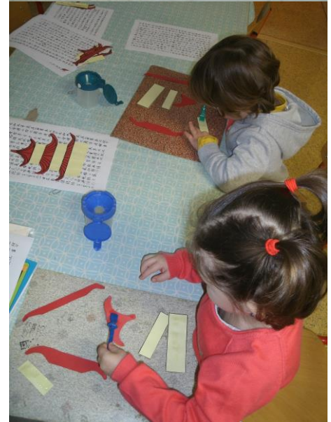
Nous avons construit et décoré des pagodes.