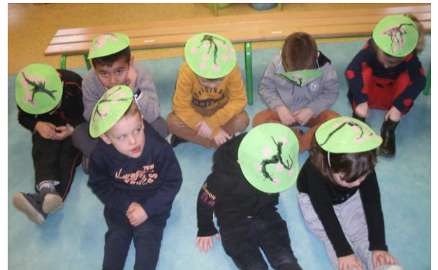
Nous avons fabriqué des chapeaux chinois.