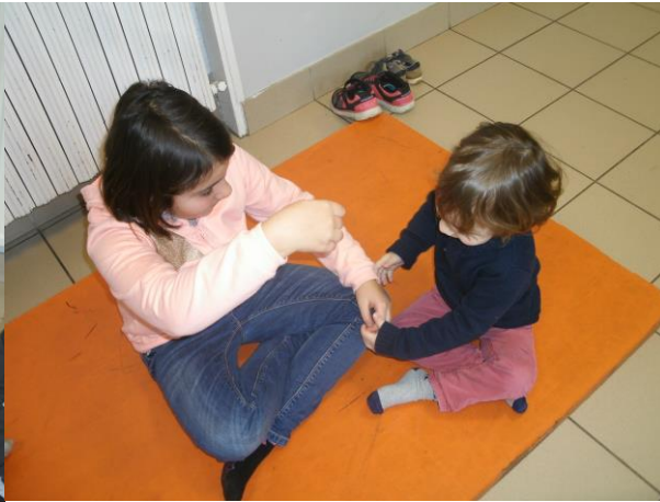
En expression corporelle, nous avons joué au sculpteur.